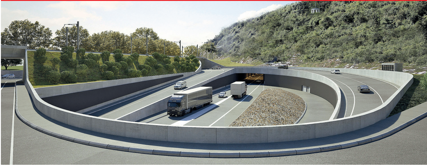
Pas de jonction autoroutière aux Prés-de-la-Rive ! Une jonction autoroutière est prévue sous le point de vue très apprécié du Pavillon, juste à côté du siège du Groupe Swatch : 280 m de long, 25-50 m de large, 11 m de profondeur.