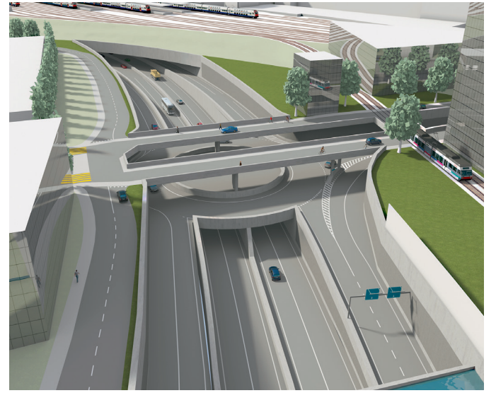
Pas de jonction à la gare ! À côté de la gare et de la Coop, autoroutière à trois étages est prévue : 275 m de long, 45 m de large, 18 m de profondeur.

Le projet alternatif du comité « Axe Ouest – pas comme ça ! » a permis d'engager le dialogue et de remporter les premiers succès. Mais le projet officiel n'est pas mort : il est juste suspendu jusqu'à la fin de l'année. Et si on ne trouve pas d'accord, il se poursuivra. C'est pourquoi nous devons élire les bonnes personnes à l'Exécutif et au Parlement !