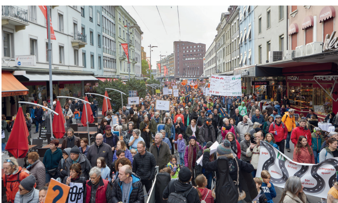
Ainsi naquit le dialogue : en automne 2017 et 2018, jusqu'à 5'000 personnes ont manifesté contre l'Axe Ouest. Seuls 21 % de la population soutiennent le projet.