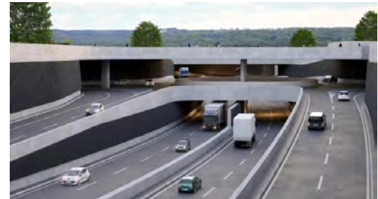
Autobahnanschluss mit Blick aus dem Mühlefeld zum Bahnhof und zur Salzhausstrasse