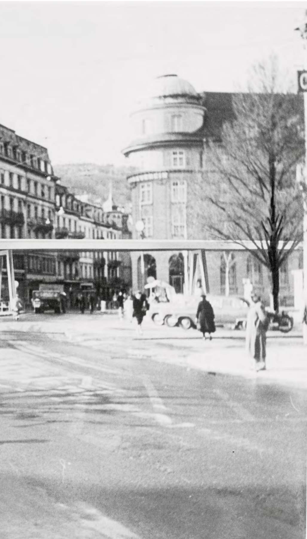
Die Expressstrasse entlang der Schüss stiess in den 1950er-Jahren zuerst einmal auf Wohlwollen in der Bevölkerung. zvg/ Stadttarchiv Biel, Bestand der Stadtpolizei (Fotomontage)

en. So war gegen Ende der 50er-Jahre eine Hochstrasse geplant, die mitten durch die Stadt Biel geführt hätte. Es sollte nicht die letzte Idee bleiben, die wieder verworfen wurde.