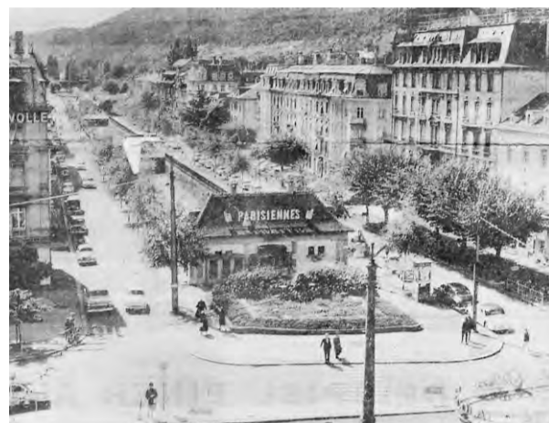
Ein Blick auf die Hochstrasse in Brüssel (oben), die dem Verkehrsplaner als Vorbild für Biel diente.