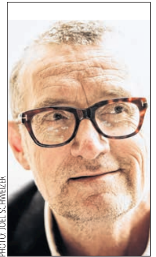
Thomas Hirschhorn. Seine geplante Ausstellung auf dem Bieler Bahnhofplatz ist umstritten.

Er mache etwas, das niemand wolle» lautet ein Zitat von Hirschhorn. – Trotzdem hat er es geschafft, sein fragwürdiges Kunstprojekt so wie er will und dort, wo er will mit einer denkwürdigen Arroganz und Selbstherrlichkeit durchzusetzen. Erneut hat er eine unglaubliche Medienpräsenz erhalten. Die Opposition einer grossen Zahl der Bieler Bevölkerung, welche sich bereits