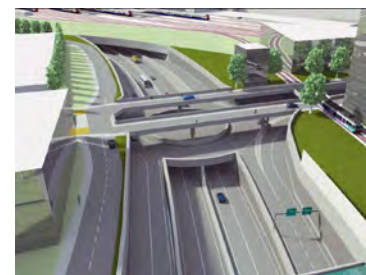
Autobahnanschluss mit Blick aus dem Mühlefeld zum Bahnhof und zur Salzhausstrasse (Visualisierung der A5-Planer).

Raccordement autoroutier en regardant du Champ-du-Moulin vers la Gare et la Rue de la Gabelle