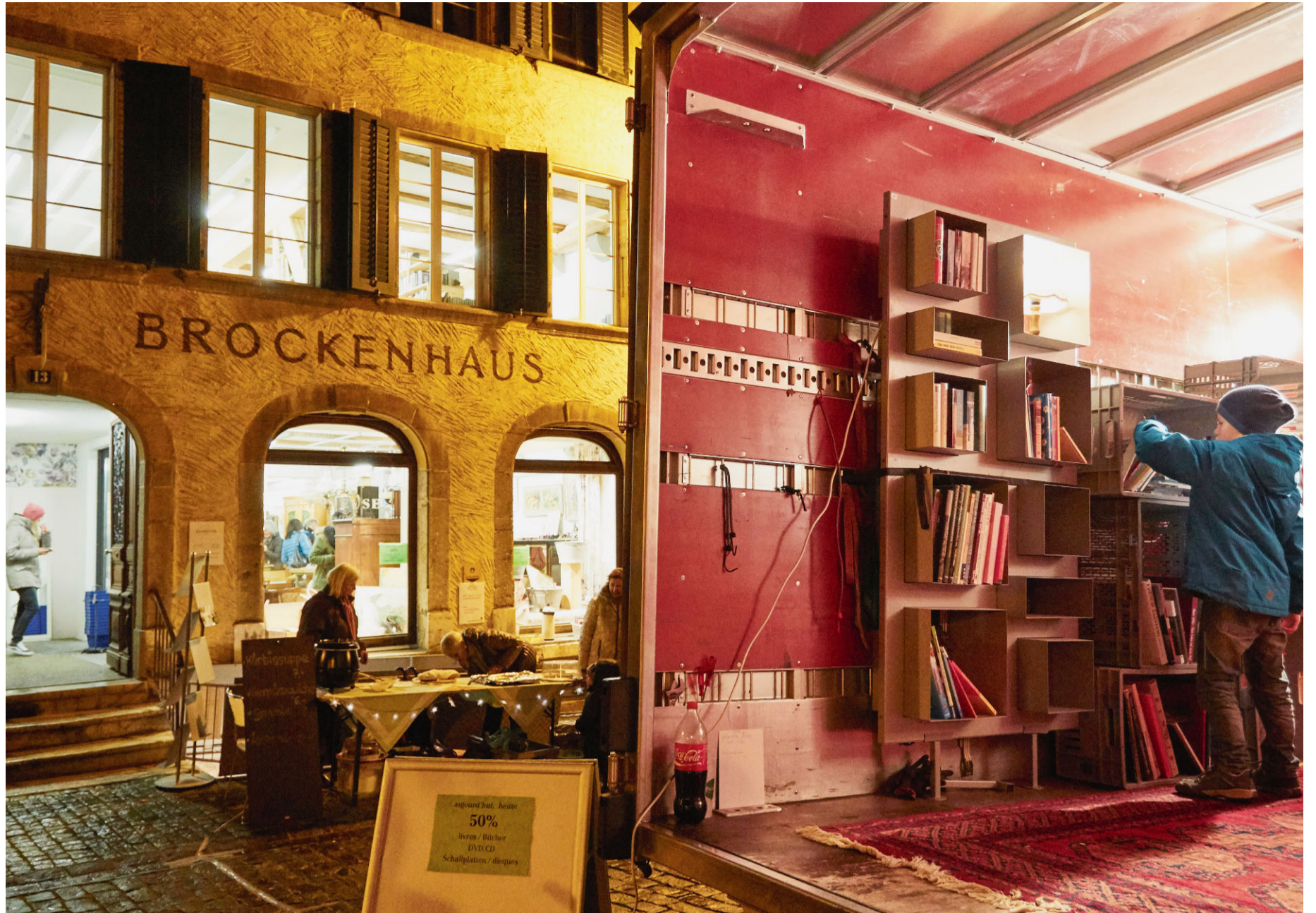
Fest für das Gewerbe: Im Mai findet die erste Ausgabe des «First Friday» in der Bieler Altstadt statt. Und der neue Anlass ist von Beginn weg ein Erfolg: Was der Altstadtchilbi schon länger nicht mehr gelang – ein Fest für das lokale Gewerbe zu organisieren – funktioniert, Gewerbler und Institutionen machen auf ihr Angebot aufmerksam. Und das Volk macht mit.